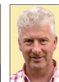
2. Karl Töpfer